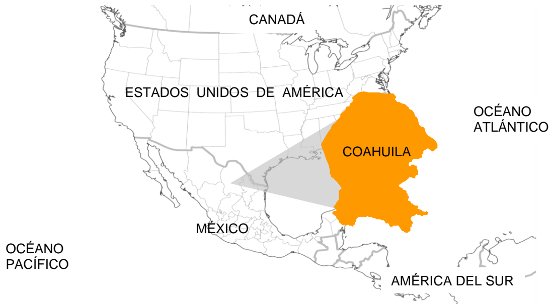
Mapa 1. Ubicación de Coahuila de Zaragoza en Norteamérica.

de México y comparte una frontera de 512 kilómetros con el estado norteamericano de Texas. En México, colinda con los estados de Chihuahua, Durango, Zacatecas, San Luis Potosí y Nuevo León.